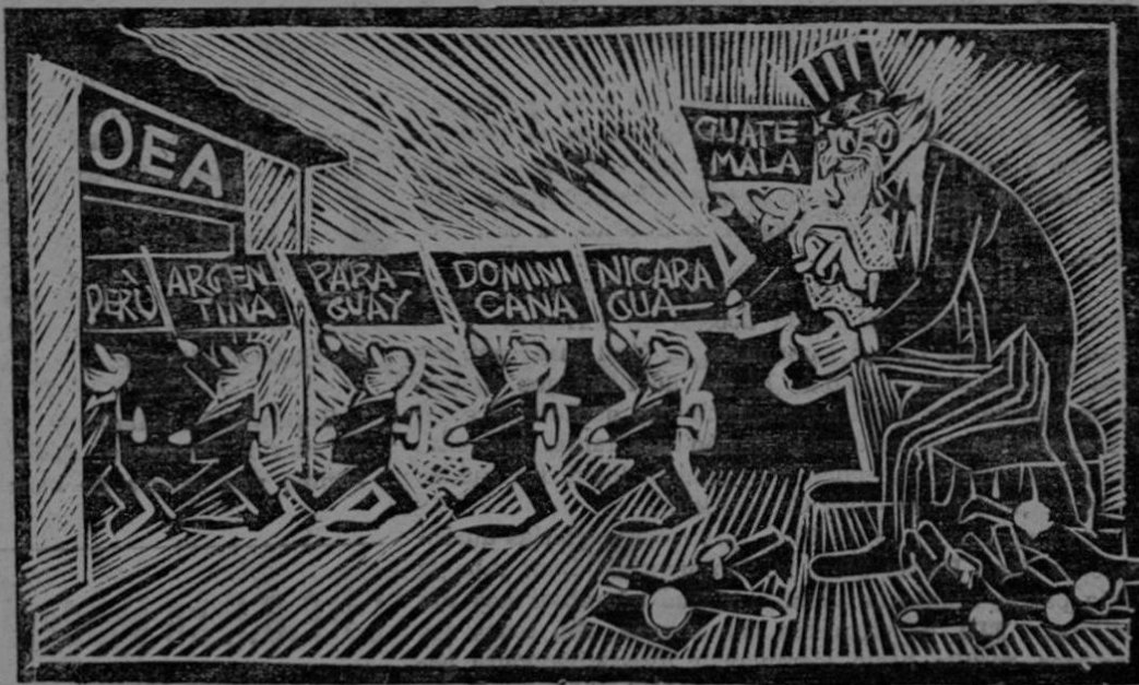
ORDEN DEL DIA: DEVOLVER A CUBA AL "BUEN CAMINO"

das las edades y de los más diversos grupos políticos, que llegaron a recibir al Canciller Roa y a sus acompañantes.